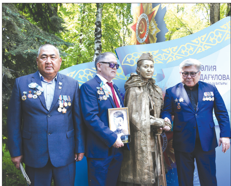
День Победы отметили в Алматы