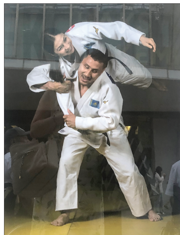
Полосу подготовила Елена СОКОЛОВА

Первыми с выставкой «Сила духа» ознакомились жители столицы. В Алматы экспозиция будет работать до 9 сентября, а затем поедет в Караганду.