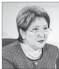
— Я лично присутствовала в селе Улкен (населенный пункт в Алматинской области, где планируется возведение АЭС. — Ред.) в прошлом году, где проходили первые публичные обсуждения, и ознакомилась там с мнением местного населения.