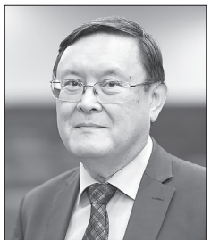
Генеральный директор Казахстанских атомных электростанций Тимур Жантикин заявил, что современные АЭС способны бесперебойно работать до 60 лет.