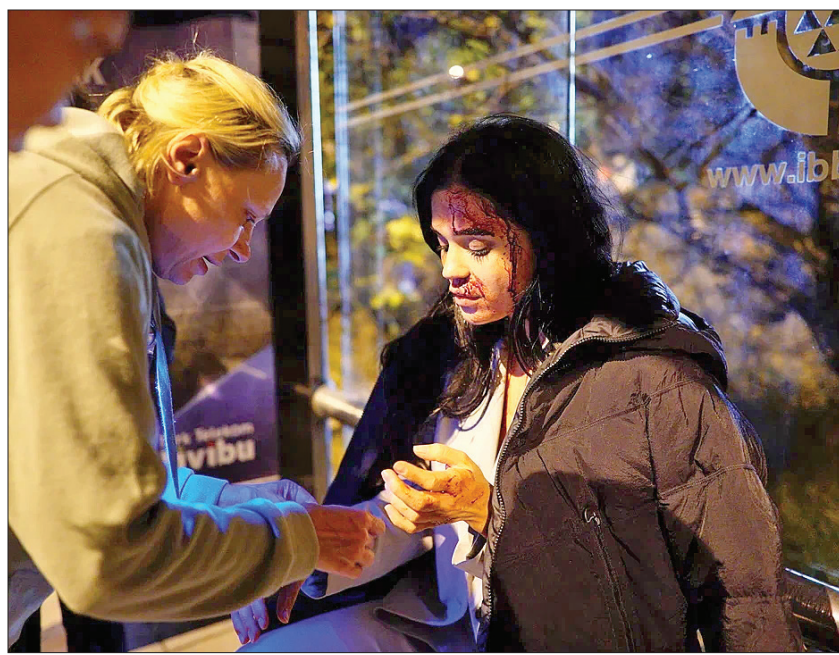
Актер Толлепберген Байсакалов впервые предстанет перед зрителями в новом амплуа