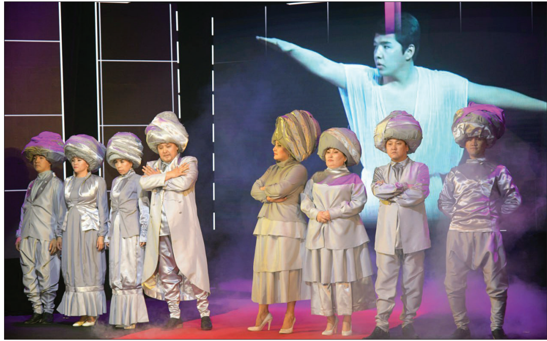
Завершился приуроченный ко Дню Республики праздник театрального искусства Almaty Puppet Festival