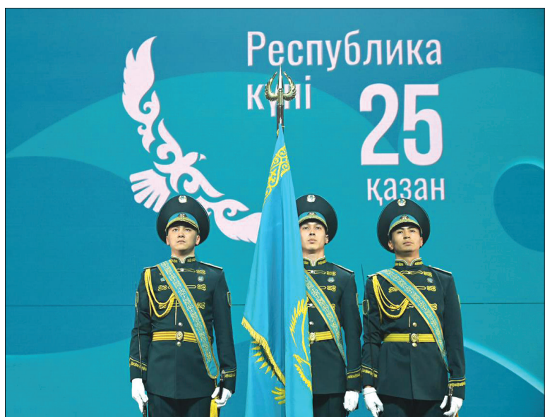
Как в Алматы празднуют День Республики