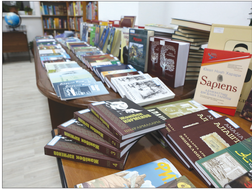
В мегаполисе проходит крупный книжный форум