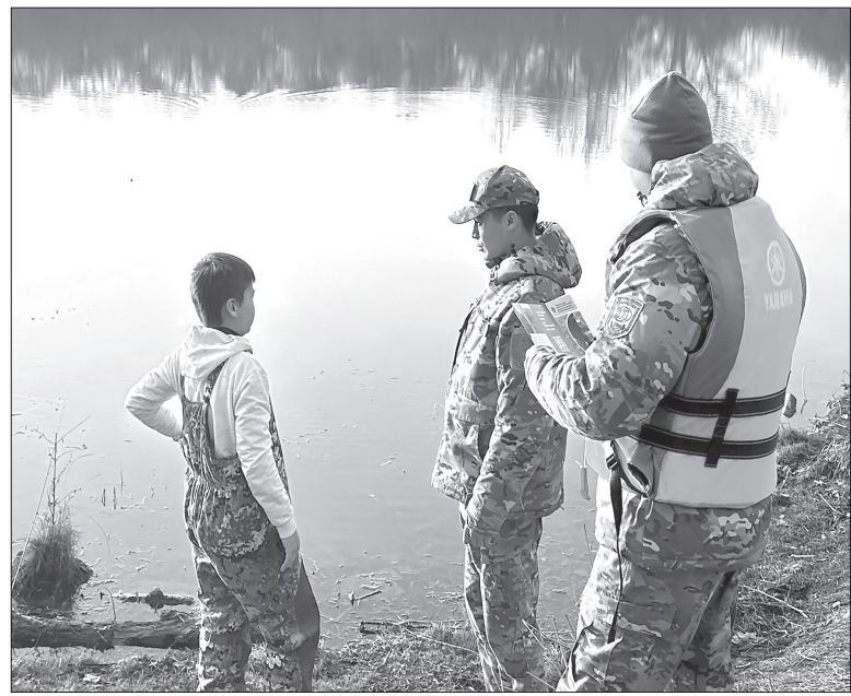
Сотрудники ДЧС Алматы уделяют большое внимание профилактической работе