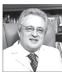
Казахстанской ассоциации репродуктивной медицины академик НАН РК Вячеслав Локшин.

— Золотой стандарт репродуктивной медицины заключается в том, чтобы предоставить бездетным парам наилучшее решение их проблем с фертильностью. В то же время гарантируя, что они не будут подвергаться ненужному риску и неэффективному