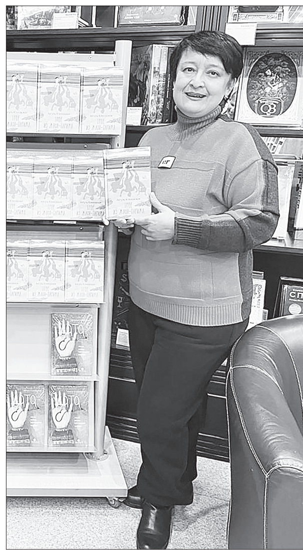
Полосу подготовила Елена СОКОЛОВА

В завершение встречи гости еще долго не расходились, продолжая общение, фотографируясь с автором и обсуждая книги. Подобные встречи, по мнению читателей, позволяют по-новому взглянуть на произведения и почувствовать живую связь между писателем и его аудиторией.