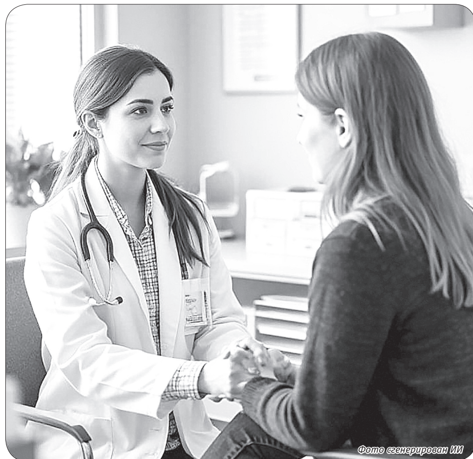
Фото сгенерирован ИИ

Ключевыми факторами успеха, как показывают эти истории, являются