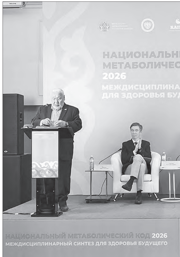
НАЦИОНАЛЬНЫЙ МЕТАБОЛИЧЕСКИЙ КОД 2026 МЕЖДИСЦИПЛИНАРНЫЙ СИНТЕЗ ДЛЯ ЗДОРОВЬЯ БУДУЩЕГО

Особый интерес вызвала практическая часть: впервые участникам предложили оформить так называемый