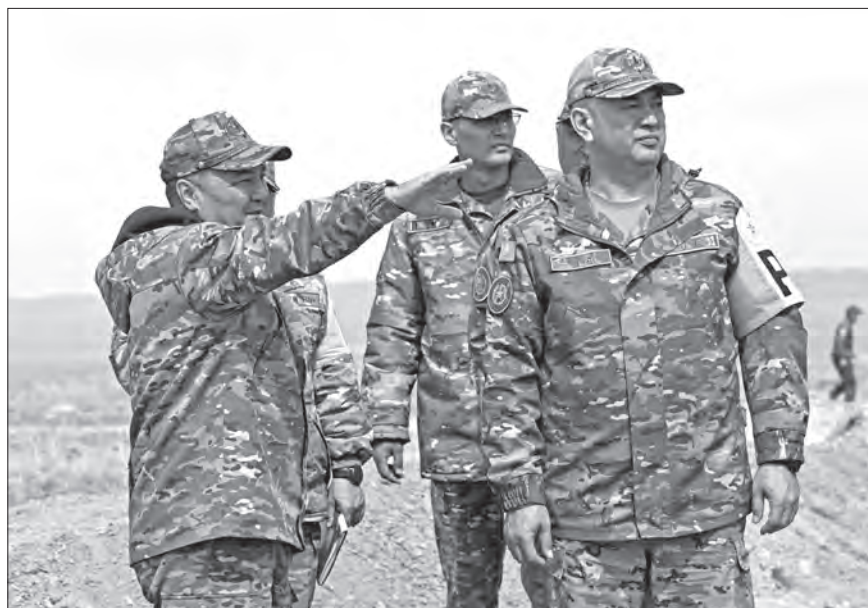
В частях Алматинского гарнизона прошла проверка