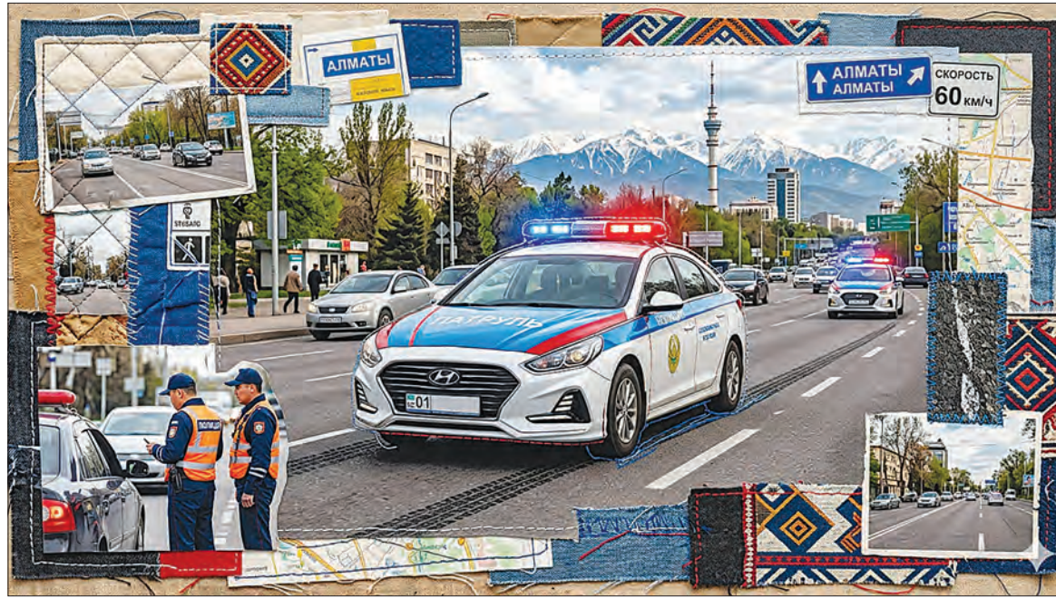
Фото сгенерировано нейросетью

– В ходе совместных мероприятий только прибывшими в Алматы сотрудниками было выявлено более 975 нарушений, – отметил Ержан Адильбеков.