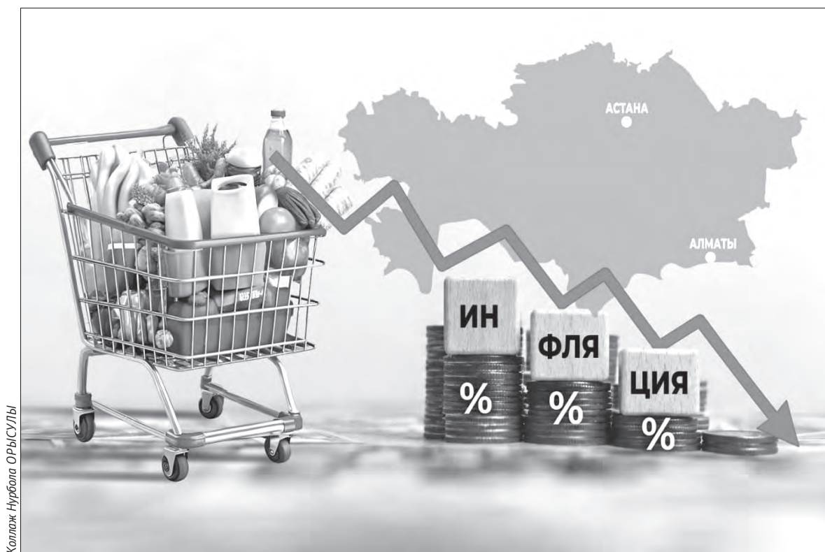
Коллаж: Нурбола ОРЫСУЛЫ

Инфляционные процессы в Алматы соответствуют общереспубликанским тенденциям