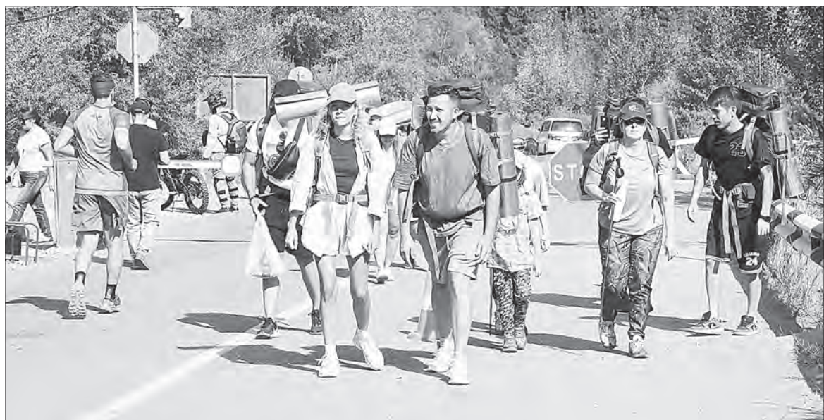
Удивление, восторг, приятная усталость – после первого же посещения Аюсай остается в памяти туристов