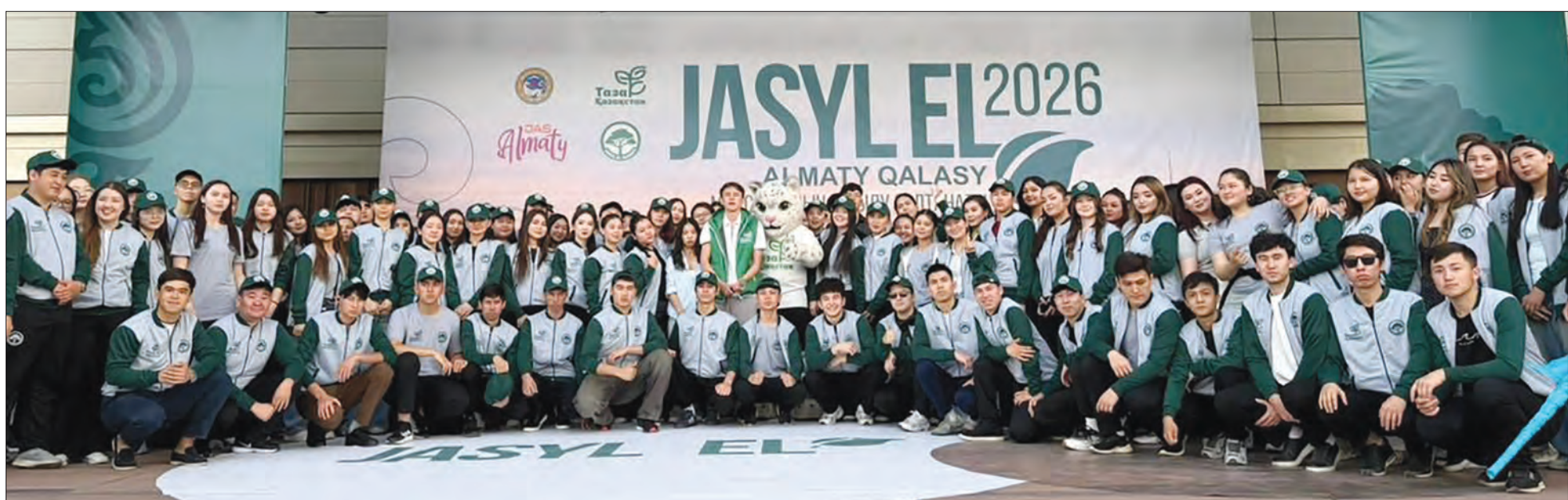
Полосу подготовил Талғат САДЫКОВ

Во всех 11 молодежных комьюнити-центрах города за последний год внедрены элементы инфраструктуры раздельного сбора отходов. Установлены фандоматы для приема пластиковых бутылок, организован сбор пластиковых крышек для вторичной переработки, на регулярной основе проводится акция «Чистый четверг» по уборке прилегающих территорий.