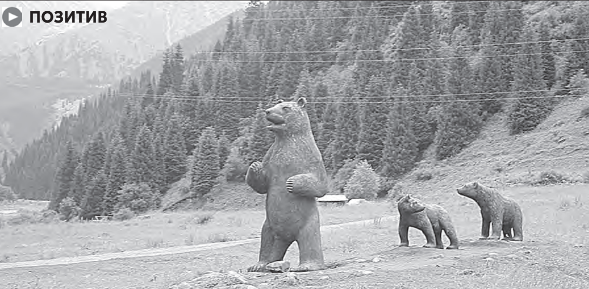
При входе в ущелье путешественников приветствуют символические фигуры трех медведей

Алматы стремительно закрепляет за собой статус главного туристического магнита Центральной Азии. По данным Управления туризма города, только в 2025 году мегаполис посетило почти 2,5 млн человек, что на 6,3% больше, чем годом ранее, 1,7 млн из них – казахстанцы.