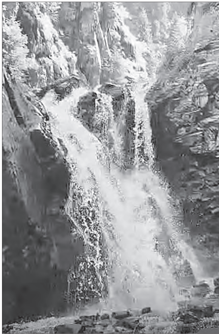
Уникальная и малоизвестная особенность локации – бурный водопад

Само название «Аюсай» переводится с казахского как «Медвежье ущелье». Ручей Аюсай образует каскад из трех